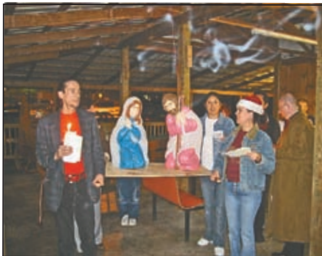
Los parroquianos de San Pedro y San Pablo en Hopkinsville, KY celebran su Posada en una tienda mexicana, el 21 de diciembre.