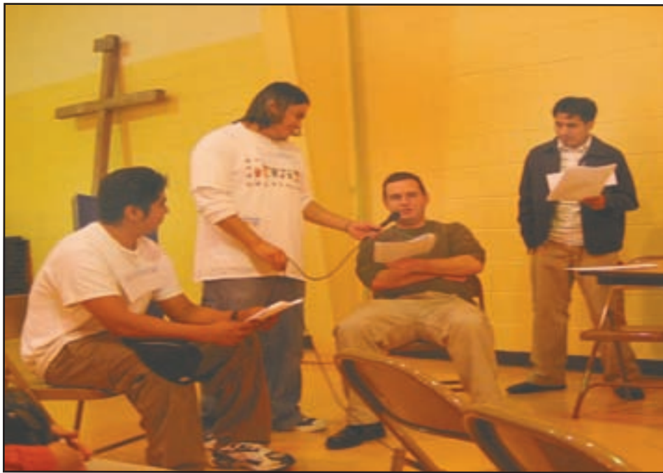
Durante la representación teatral reflexionamos sobre la pasión y muerte de Jesucristo.

HOPKINSVILLE, Ky. - Que importante es conocer mejor nuestra fe católica, nuestras tradiciones, nuestras celebraciones litúrgicas y devociones. A través de los siglos lo mismo que en la actualidad los cristianos se han esforzado por comprender mejor los elementos